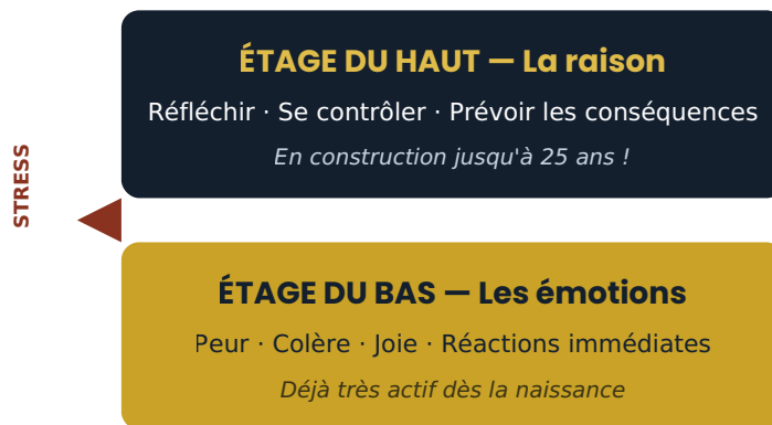
Figure 1 — Le modèle du « cerveau à deux étages » : sous stress ou sous peur, l'escalier vers l'étage de la raison se ferme.

Imaginez le cerveau de votre enfant comme une maison en construction, avec deux étages :