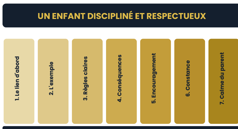
Figure 2 — Les 7 piliers : retirez-en un seul, et l'édifice devient instable.