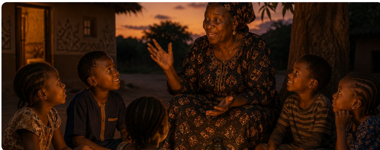
Le conte du soir : notre plus ancienne école de sagesse.